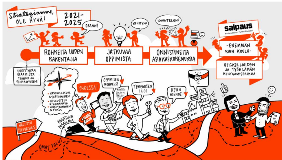
Katso Salpauksen strategiavideo Strategia, säännöt ja ohjeet - Koulutuskeskus Salpaus