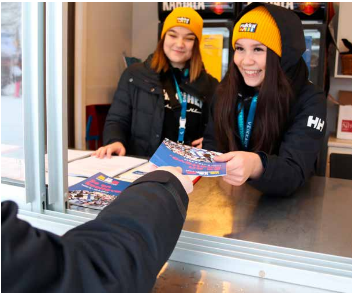
Kuva 6 Salpauksen opiskelijat voivat olla työpaikalla oppimassa yrityksissä tai tapahtumissa.

Tilintarkastuksessa vuoden 2019 osalta ei tullut olennaisia havaintoja. Tilintarkastus on toteutettu suunnitelman mukaisesti.