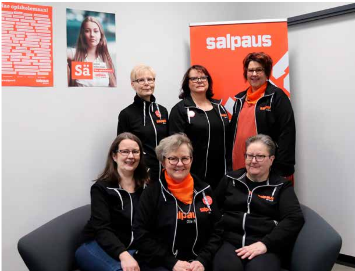
Kuva 2. Ohjauspiste Sunnan opinto-ohjaajat palvelevat kaikkia koulutuksesta kiinnostuneita, alasta riippumatta.

Seuraavaan taulukkoon on kerätty vuoden 2018 arviointikertomuksessa todettuja keskeisimpiä havaintoja tavoitteisiin ja niiden toteutumiseen liittyen ja myös niihin annettuja vastineita.