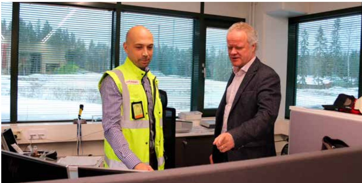
Kuva 5. Salpaus tarjoaa uutta osaamista yrityksille ja käytännönläheistä tukea liiketoiminnan kehittämiseen ja johtamiseen.

Toimitilamuutoksia on toteutettu suunnitelmallisesti, on onnistuttu luopumaan tarpeettomista tiloista sekä kunnostamaan vanhoja tiloja nykyiseen opetukseen soveltuviksi. Saadulla strategiarahalla pystytään jatkamaan tilojen kehittämistä edelleen.