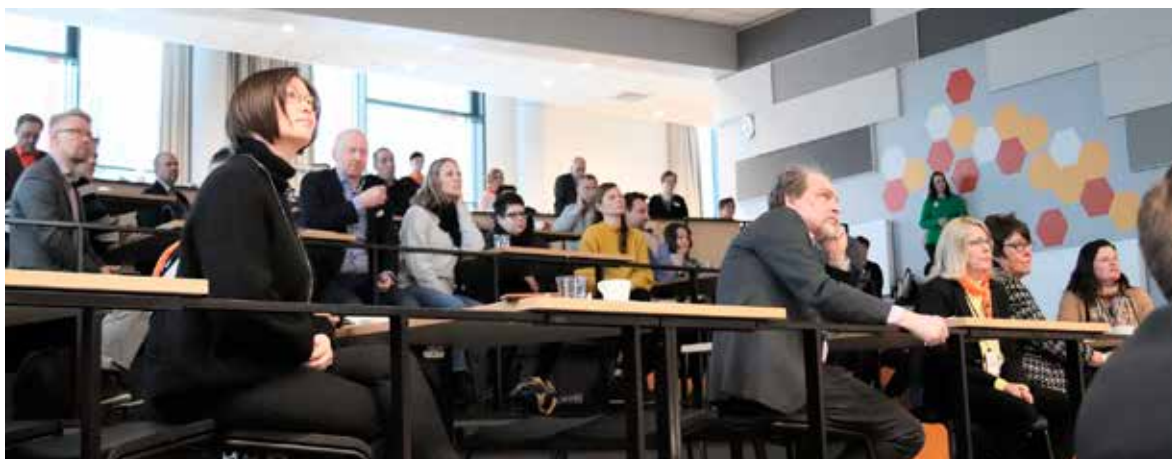
Kuva 3. Vipusenkadun Teknologiakampuksella järjestettiin työelämäseminaari Uudistunut ammatillinen koulutus.