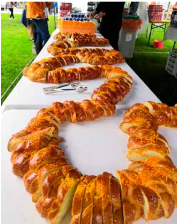
Kuva 4. Ilmasto ja yhdessä tekeminen olivat pääosassa Salpauksen opiskelijoiden ja henkilöstön Kyläjuhlissa.

Kolmas osa-alue on johtamisen ja lähiesimiestyön vahvistaminen ja johtamisen tulee olla arvojen mukaista sekä eettistä. Vuonna 2019 johtaminen on monelta osin keskittynyt uuden vuosityöajan johtamiseen ja esimiestyöllä on tuettu vuosityöaikaan siirtymistä sekä suunnittelua kalenterivuoden mukaiseen toimintaan. Lisäksi huomiota on kiinnitetty HOKS:eihin tekemällä arviointia ja vahvistamalla toimintamalleja sekä Luotsi-toimintaa. On otettu käyttöön uusi yhdessä johtamisen -malli sekä säännölliset viikko-/kuukausipalaverit.