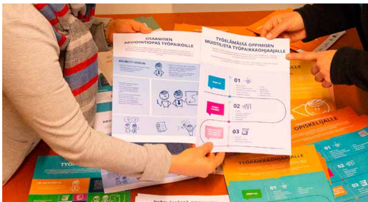
Kuva 1. Työhön perehdyttäminen auttaa opiskelijan onnistumista, työpaikkaohjaajalla on siinä tärkeä rooli.