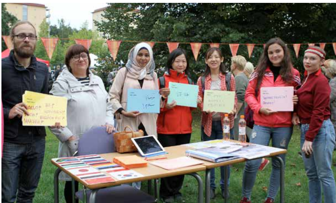
Kuva 3. Maahanmuuttajaopiskelijat mukana opiskelijoiden ja henkilöstön yhteisessä syksyn avaustapahtumassa, Kyläjuhlassa.

Lautakunta arvioi saamansa selvitykset riittäviksi.