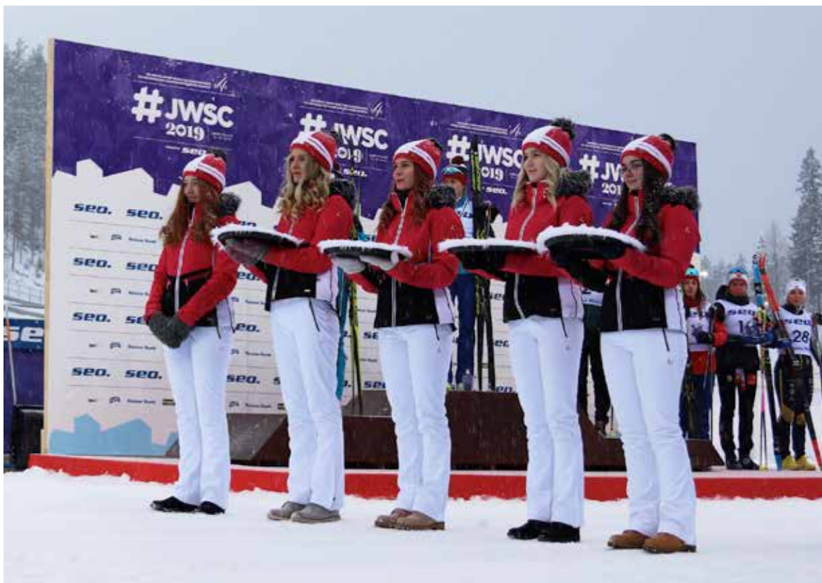
Kuva 7. Salpauksen matkailualan opiskelijat nuorten MM-kilpailuissa Salpausselällä