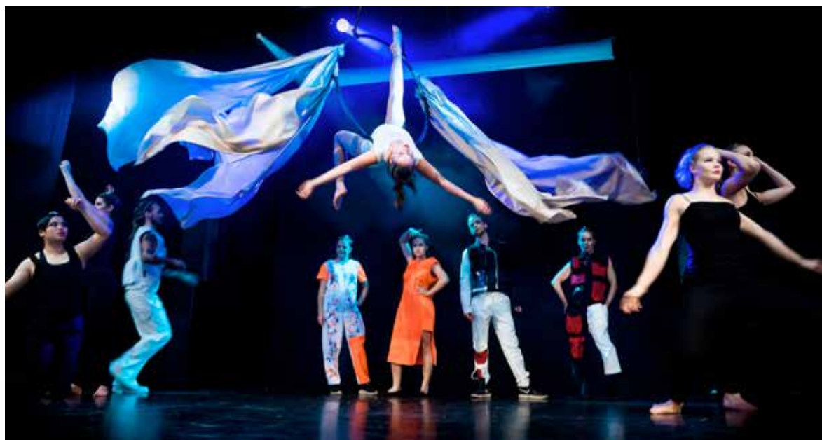
Kuva 1. Salpauksen opiskelijoiden työnäytös Kätevä&Tekevä 2018 -messuilla.