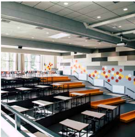
Kuva 6. Vipusenkatu 5 A:n uudet tilat otettiin käyttöön. Kuvassa näkymä ravintola-auditoriosta.