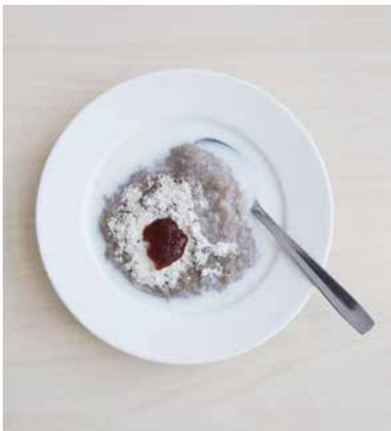
Kuva 5. Opiskelijoilla ja henkilöstöllä on mahdollisuus nauttia maksuttomasta aamupuurosta joka aamu.

Kolmas osa-alue on johtamisen ja lähiesimiestyön vahvistaminen ja johtamisen tulee olla arvojen mukaista sekä eettistä. Vuosityöaikaa siirtymisen tuo suuria muutoksia jokaisen opettajan työhön ja tähän on varauduttu Salpauksessa pitämällä yhteisiä koulutuksia ja kokouksia. Toiminnan suunnittelua on uudistettu vastaamaan lakimuutosta ja vuosisuunnittelu on keskitetty salpaustasoisiksi palveluksi. Esimiestyön kehittämiseen on aloitettu hanke sekä kerätty tietoa toiminnan kehittämiseen haastattelemalla esimiehiä ja tekemällä arviointia heidän arjestaan.