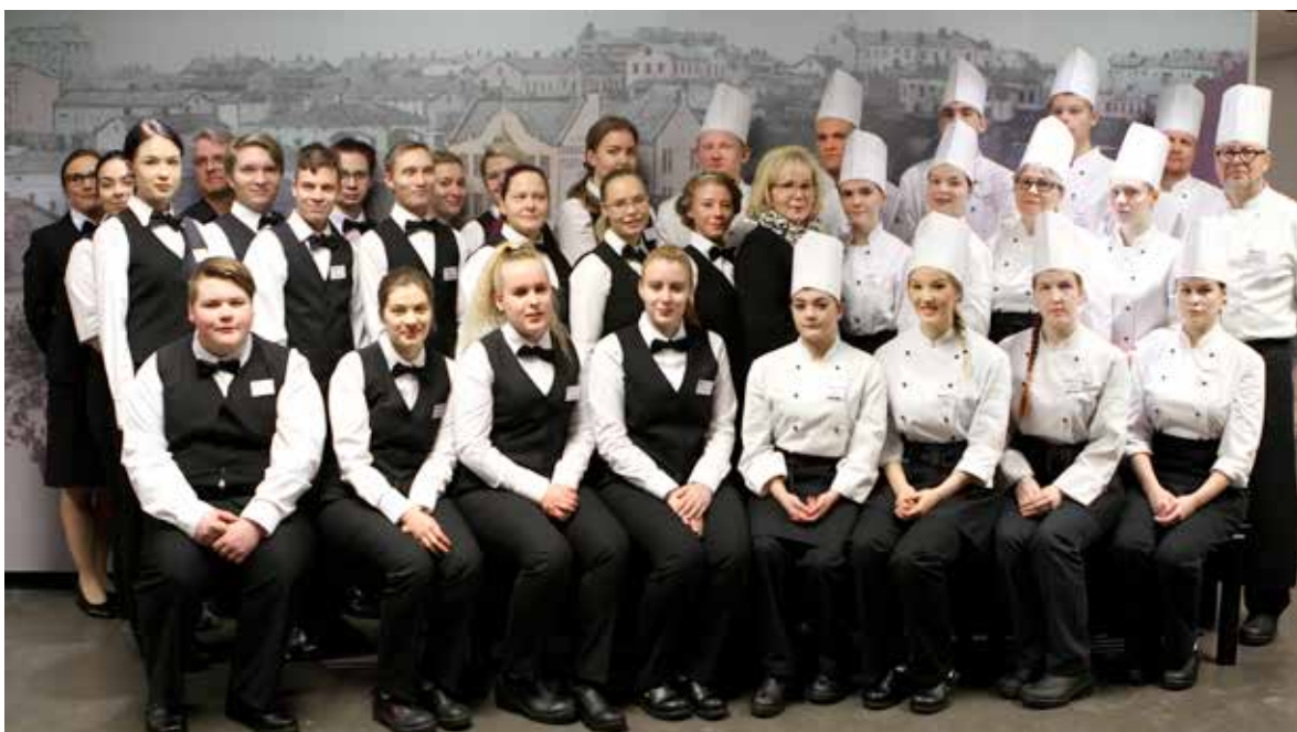
Kuva 2. Opiskelijat mukana Tasavallan Presidentin Linnan juhlien järjestelyissä.

Seuraavaan taulukkoon on kerätty vuoden 2017 arviointikertomuksessa todettuja keskeisimpiä havaintoja tavoitteisiin ja niiden toteutumiseen liittyen ja myös niihin annettuja vastineita.